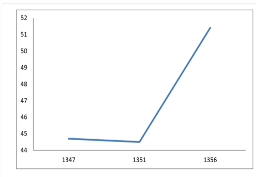
نمودار ۳. ضریب جینی در ایران (احمدی، ۱۳۹۷)