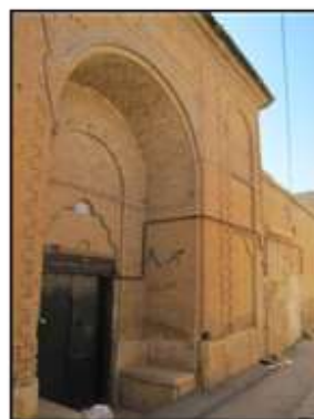
شکل ۳- نمونه‌ای از ایجاد سکو و پیرنشین سایه‌دار در ورودی خانه‌های سنتی، شیراز، ایران

استفاده از رنگ‌های زیبا و سرورآفرین و متعالی مانند سبز زمردی و آبی لاجوردی در کاشیهای سردر خانه‌ها و مساجد تا ایجاد باغ‌های سرسبز و زیبا. آنها با سنگ‌فرش خیابان‌ها و مسیرها هدف خلقت راه‌ها، یعنی هدایت را به نمایش گذاشتند و آسمان شهرشان را به زینت روشنایی چراغ‌ها آراستند. «در زمانی که شب‌ها حتی یک چراغ روشن در خیابان‌های شهر لندن وجود نداشت و در خیابان‌های شهر پاریس نیز حتی تا قرن‌ها بعد اثری از سنگ‌فرش به چشم نمی‌خورد، خیابان‌ها و معابر