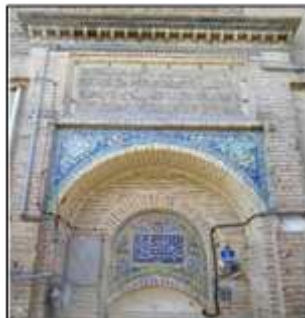
شکل ۲- نمونه‌ای از تزئینات و کاشی‌کاری سردر خانه‌های سنتی، شیراز، ایران

سکوه‌های سایه‌دار (شکل ۳) و کاشی‌هایی که جلوه‌ای از زیبایی‌های بهشت بودند تا عالی‌ترین درجه خلق زیبایی در مساجد (شکل ۴).