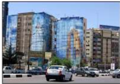
شکل ۶- نمونه‌ی زیباسازی‌های تصنعی، سطحی و ظاهری در شهرهای معاصر، شیراز، ایران

رخداد عده‌ای موضوع سلیقه و نسبی بودن زیبایی را برجسته نموده‌اند و به این ترتیب زیبایی را در حد مد و برخی موضوعات ظاهری و مادی فرو می‌کاهند و به ارزش‌های معنوی اعتقاد ندارند. حال آن‌که آن زیبایی که برآمده از هویت و اعتقادات باشد، علقه و دلبستگی می‌آورد، آرامش می‌آورد و در نهایت تعالی؛ اما چه شده که امروز هرچه زیبایی‌های ظاهری افزایش می‌یابد، باز آرامشی حاصل نمی‌شود و احساس زیبایی درک نمی‌گردد؟ آیت‌الله جوادی آملی می‌گوید، اینان که زیبایی را در حد مد تقلیل می‌دهند، «متخیل بالفعل و عاقل بالقوه‌اند» (جوادی آملی، ۱۳۸۹: ۲۳)، چراکه بر مبنای خیال عمل نموده‌اند نه بر مبنای عقل سلیم، که زیبایی حقیقی را می‌پسندد و این می‌شود که نه تنها ادراک زیبایی از شهر رخ نمی‌دهد، چه بسیار تخریب زیبایی هم صورت می‌گیرد (شکل ۵) زیرا شهروندان امروز، زیبایی موجود را برآمده از درون خود و مأنوس با خود نمی‌بینند و آن را تصنعی و تزئینی (شکل ۶) درک می‌کنند و لذا نیاز زیبایی‌جویی آن‌ها اغنا نمی‌شود.