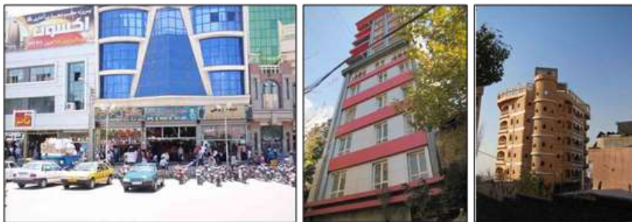
شکل ۱۳- نمونه‌هایی از احجام و فرم‌های مجسمه‌وار و دعوت‌کننده به عالم ماده، مشهد و تهران، ایران نشریات علمی دانشگاه جامع امام حسین (علیه‌السلام)

در شهرهای سنتی احجام و فرم‌ها انسان را به‌صرف تماشای خویش دعوت نمی‌کردند، انسان با نگریستن در آن‌ها معنایی از حقایق را درک می‌کرد و آن‌ها وسیله‌ای بودند برای شناساندن مفاهیم متعالی، اما شهرهای امروزی سرشارند از فرم‌ها، اشکال و احجام مجسمه‌واری که به خویش، به‌مثابه یک بت، فرامی‌خوانند و نگاه انسان را از عالم افلاک به عالم خاک محدود می‌کنند و او را بیشتر به عالم مادیات گره می‌زنند (شکل ۱۳).