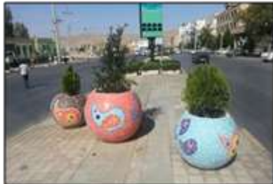
شکل ۸- عناصر تزئینی کم‌دوام و منفک از زمینه که صرفاً به صورت عامل تزئین ظاهری به کار رفته‌اند، شیراز، ایران