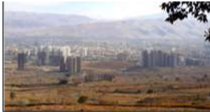
شکل ۱۰- گسست فضایی، پراکنده رویی، پاشیدگی کالبدی و تکه‌تکه بودن شهرهای معاصر، شیراز، ایران

قرار گرفته‌اند و با یکدیگر یک کل واحد را شکل داده‌اند. «ظهور وحدت در یک پدیده (اعم از وحدت بین اجزا آن و وحدت بین آن پدیده با سایر پدیده‌ها و با کل هستی) از مهمترین عواملی است که ظهور آن می‌تواند پدیده را به صفت زیبایی متصف گرداند» (نقی‌زاده، ۱۳۸۶: ۲۹۴). در شهرهای سنتی شهر برآمده از طبیعت بود، نه تحمیل شده بر آن، با آن در تعامل سازنده بود و جزئی تکمیل‌کننده به حساب می‌آمد. دیگر اینکه در خود شهر نیز، اجزای مختلف شهر از خانه گرفته تا خیابان‌ها و میدان، بازارها و مساجد، هیچ‌کدام بدون ربط و پیوستگی از هم نبودند و هرکدام در عین استقلال در یک پیوستگی معقول، کلیت و وحدتی را به نمایش می‌گذاشتند (شکل ۹). ولی شهرهای امروزی تکه‌تکه و ناپیوسته‌اند و به صورت یک کل واحد درک نمی‌شوند (شکل ۱۰). ارتباط آن‌ها با طبیعت نه تنها ارتباط یگانه‌تنی نیست که ارتباطی تخریب‌گرایانه است و نوعی نگاه چیره‌جویانه و تسلط‌طلبانه بر طبیعت دارند که این در تضاد با وحدت کلیه اجزای عالم هستی است.