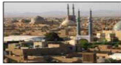
شکل ۹- انسجام، یکپارچگی و پیوستاری شهرهای تاریخی جلوه‌ای از ظهور وحدت، یزد، ایران