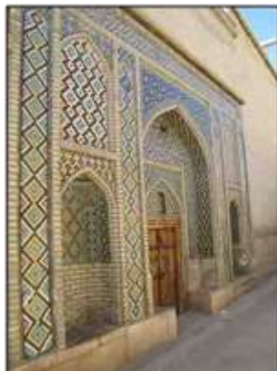
شکل ۱۶- نمونه‌ای از کاربرد رنگ در کاشی‌کاری‌ها و نماهای شهری

رنگ از جهات متعددی از قبیل حظ بصر و لذت ناظرین و ایجاد سرور و بهجت در آنان، هماهنگی با هویت و عملکرد پدیده و زمینه و... در تعریف و تفسیر زیبایی یک موضوع ایفای نقش می‌کند (نقی‌زاده، ۱۳۸۶: ۲۹۶) (شکل ۱۵). در شهرهای سنتی آنجا که نیاز به آرامش و سکون است، رنگ‌های سرد مثل سفید، آبی، سبز و... و آنجا که نیاز به شادی و سرزندگی است رنگ‌های گرم مثل زرد، قرمز و... استفاده می‌شود (شکل ۱۶). خانه محل آرامش است پس سفید است. مسجد محل آرامش روحانی و درعین حال نشاط معنوی است پس سبز زمردی و آبی لاجوردی و حتی زرد در آن به کار می‌رود. تک‌رنگ آبی کاشی سردر خانه‌ها در زمینه یک‌دست سفید یا نخودی می‌گوید خانه علاوه بر محل سکون بودن، محل تعالی است.