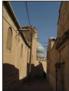
شکل ۱۱- گنبد، عنصر مسلط در شهرهای سنتی و نمادی از تجرد و معنویت، شیراز، ایران

در شهرهای سنتی احجام و فرم‌ها انسان را به‌صرف تماشای خویش دعوت نمی‌کردند، انسان با نگریستن در آن‌ها معنایی از حقایق را درک می‌کرد و آن‌ها وسیله‌ای بودند برای شناساندن مفاهیم متعالی، اما شهرهای امروزی سرشارند از فرم‌ها، اشکال و احجام مجسمه‌واری که به خویش، به‌مثابه یک بت، فرامی‌خوانند و نگاه انسان را از عالم افلاک به عالم خاک محدود می‌کنند و او را بیشتر به عالم مادیات گره می‌زنند (شکل ۱۳).