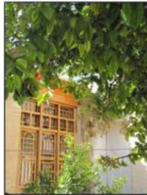
شکل ۱۴- جلوه‌هایی از حضور طبیعت و طراوت در خانه‌های سنتی، شیراز، ایران