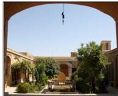
شکل ۱- نمونه‌ای از ترکیب حوض، درخت و تخت در خانه‌های سنتی، یزد، ایران