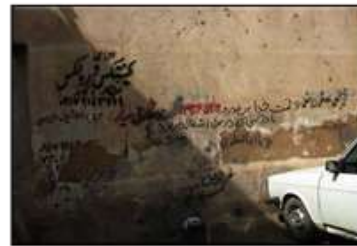
شکل ۵- نمونه‌ای از تخریب زیبایی و زشت نمودن شهر توسط شهروندان، شیراز، ایران

پس در این مسیر نیاز است به اصالت زیبایی و آنچه جوهره اعتقادی انسان بوده و با فطرت او عجین است، بازگشت نمود و به جای این که مسئولین شهری به زیباسازی تصنعی، ظاهری و زودگذر شهر پردازند (شکل‌های ۷ و ۸)، باید امر زیبا ساختن شهر و زیباسازی آن را دوباره به فرایندی از درون به بیرون، پویا و برآمده از وجود تک‌تک اعضای جامعه تبدیل کنند و از رهگذار باورهای دینی، اعتقادی و فرهنگی و نه قوانین خشک رسمی، مردم را به زیبا ساختن شهر خود ترغیب نمایند.