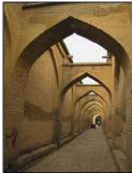
شکل ۱۲- طاق‌ها و قوس‌ها در شهرهای سنتی؛ جلوه‌ای از سیر در معنا و عروج، شیراز، ایران

است از اشکال، احجام، فضاها و مکان‌هایی که این معنی را القا می‌کنند (شکل ۱۲). از نقوش کاشی سردر خانه‌ها گرفته که نمادی از زیبایی بهشت‌اند تا مسجد با گنبد و مناره‌های آن که نمادی از حضور انسان در زیر گنبد آسمان در محضر خداست (شکل ۱۱).