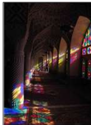
شکل ۱۵- نمونه‌ای از کاربرد نور و رنگ در مساجد تاریخی، شیراز