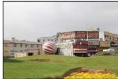
شکل ۷- عناصر [المان] فرمالیستی و فاقد عمق معنایی در «زیباسازی» شهر معاصر، شیراز، ایران