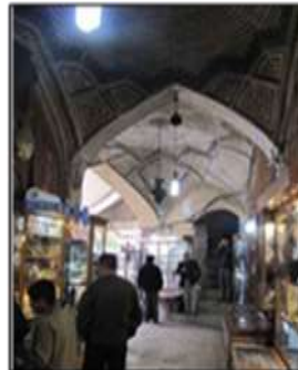
شکل ۱۷- جلوه‌ای از آگاهی‌بخشی و تذکردهی در نماسازی خانه‌های سنتی و فرم‌های هندسی بازارهای ایرانی، شیراز، ایران